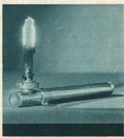
Vue du "PIP" éclairage (dimensions 27 x 8) Poids : 200 grammes