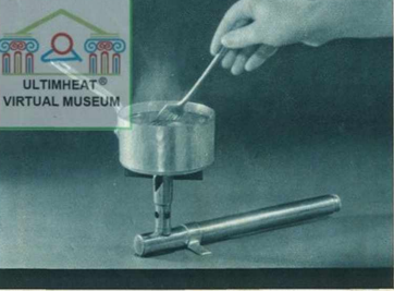
Vue du "PIP" muni de son support