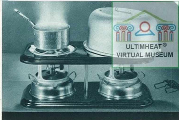
Application du Four-Cloche "Tito Landi"